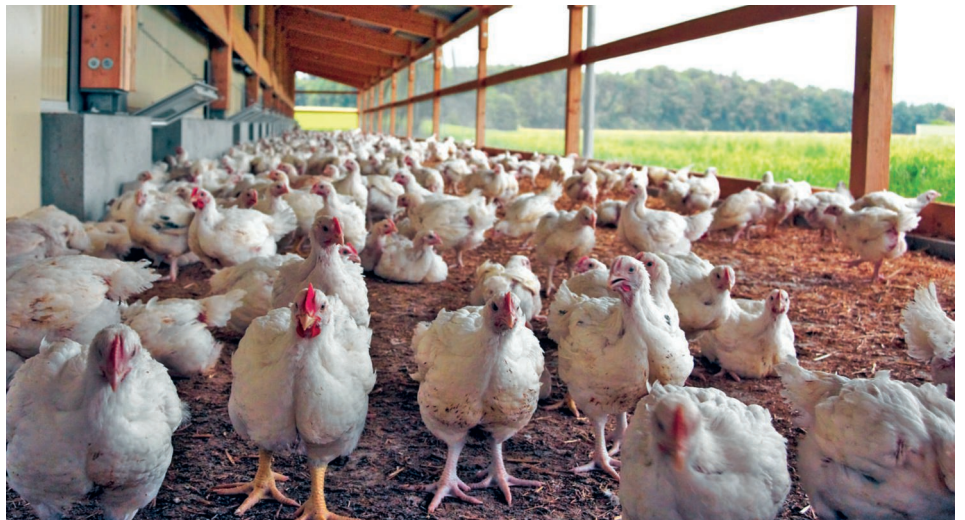
Tierhaltung ist nicht nur in der Schweiz ein emotionales Thema.

Das Tierschutzgesetz in der Schweiz regelt bereits vieles, zusätzliche Beiträge für den Tierschutz werden vielleicht deshalb nur zögerlich ausgegeben. 2019 bezahlte der Bund 2,8 Milliarden Franken Direktzahlungen aus. Davon floss zwar nur ein Zehntel in die beiden Tierwohlbeiträge BTS und RAUS. Im 2020 überarbeiteten Tierschutzgesetz ist aber beispielsweise neu das fachgerechte und tierschutzkonforme Töten definiert. Auch der Transport von Labeltieren wurde 2021 neu geregelt. Mastschweinen wird ab diesem Jahr mehr Platz im Transporter zum Schlachthof zugestanden, weil diese in den